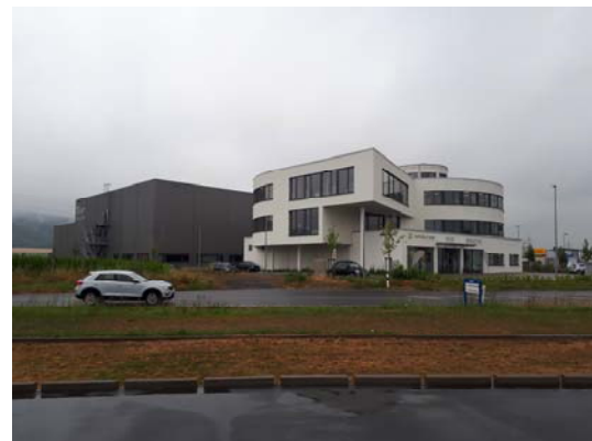
Blick vom Grundtalring auf das Gelände