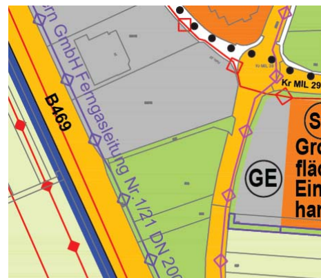
Auszug aus dem Flächennutzungsplan, Plan unmaßstäblich

Der Flächennutzungsplan wird entsprechend den Festsetzungen des Bebauungsplans im Parallelverfahren geändert.