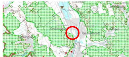
Regionalplan Karte 3 – Landschaft und Erholung