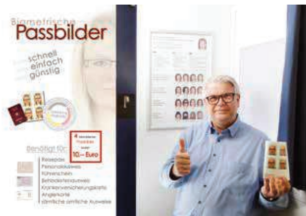
1. Bürgermeister Roland Eppig beim Anfertigen der ersten Passaufnahme in dem neuen Automaten.

1. Bürgermeister Roland Eppig zeigte sich erfreut, dass Großwallstadt als eine der ersten Gemeinden im Landkreis seinen Bürgern diese besondere Dienstleistung direkt vor Ort im Rathaus anbieten kann und ist überzeugt, dass die Bürger diesen Service gerne nutzen werden.